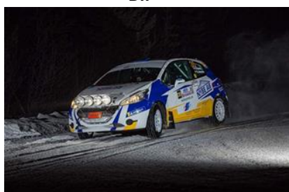
Peugeot 208 R2